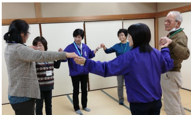
豊里交流センターにて